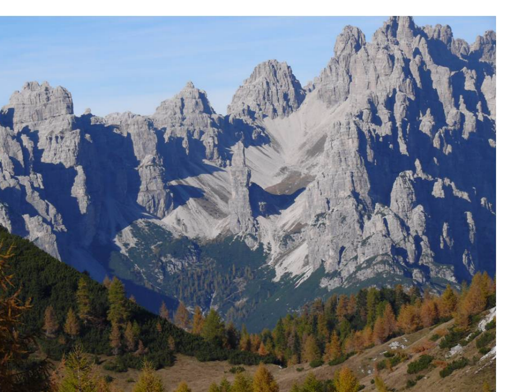
PIANO DI CONSERVAZIONE E SVILUPPO DEL PARCO NATURALE DOLOMITI FRIULANE