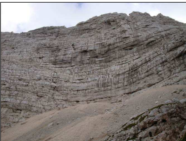
Figura 5 - Parete nord della Punta Plagnis (Gruppo del Montasio) costituita da Calcarea del Dachstein.