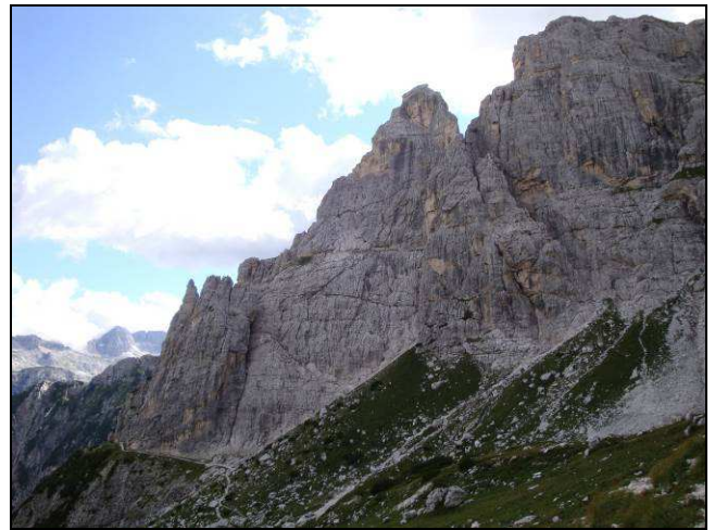
Figura 4 - Breccia vulcanica d'esplosione visibile lungo la strada per il Lussari (Vulcaniti di Riofreddo).