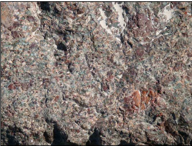
Figura 3 - Breccia vulcanica d'esplosione visibile lungo la strada per il Lussari (Vulcaniti di Riofreddo).