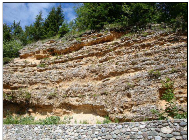
Figura 6 - Deposito alluvionale pleistocenico visibile lungo la strada per l'Altipiano del Montasio.